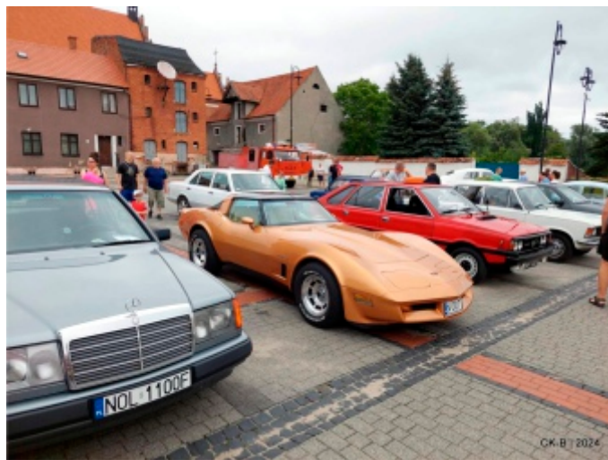
Fot. Archiwum CK-B (2)