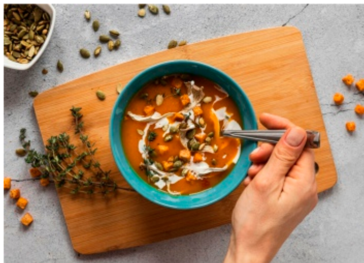
Zdjęcie poglądowe

1. Przygotowanie owoców: Suszone owoce (śliwki, jabłka, gruszki, morele) należy dokładnie umyć pod zimną wodą,