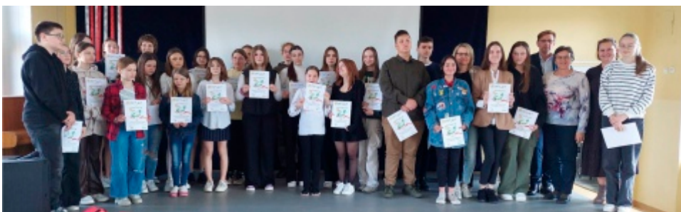
Tekst i foto na podstawie archiwum internetowego Gminy Barczewo