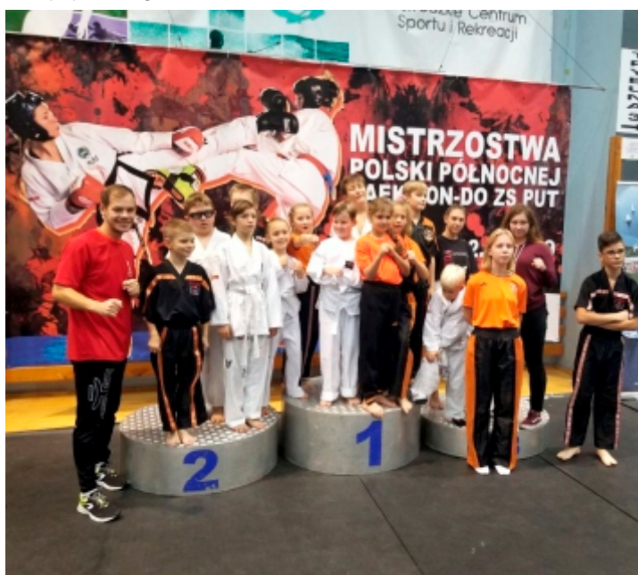
Tekst i zdjęcie: KS Egida